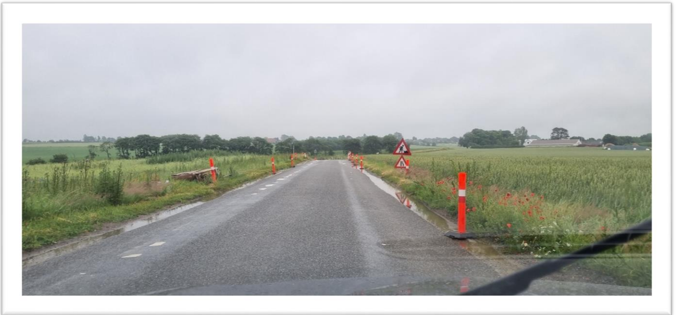
Figur 1 Abelonelundvej - Skolevej 2-i-1 – vil du have dit barn til at cykle her?

Strib er igennem en årrække vokset og nye boligområder er kommet til og flere er planlagt. I en pendlerby som Strib giver det en voldsom forøgelse af trafikken til/fra Strib på daglig basis – der er nævnt 2000+ biler i tillæg til nuværende. Dette giver en forøget belastning af vejnettet såvel under opførelse (med store køretøjer) som efterfølgende. Belastningen vil kunne mærkes – og mærkes allerede - i områder af Strib, på Strib Landevej, i Vejlbj, i Røjle m.fl. – og flere af vejene er skoleveje.