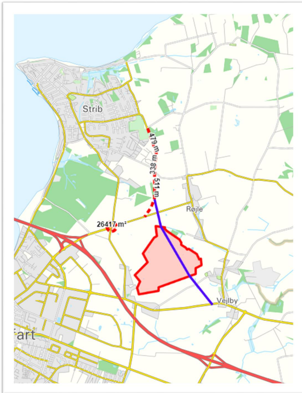
Figur 4 Kort med linjeføring af planlagt omfartsvej, ønske til forlængelse og solcellepark-område.

I Strib Lokaludvalg og Røjlehalvøens Lokaludvalg er vi ikke i tvivl. Vi skal agere nu for at vi ikke ender med et trafikkaos på veje, der er for smalle til at håndtere en stigende trafikmængde, en stigning i trafikken gennem eksempelvis vores landsbyer Røjle og Vejlbj, en stigning i trafikken på vores skoleveje m.v. If. skoleveje og stier arbejdes der sideløbende på at få lavet en grussti langs Abelonelundvej, som vi også ønsker at presse på for at få etableret hurtigst muligt.